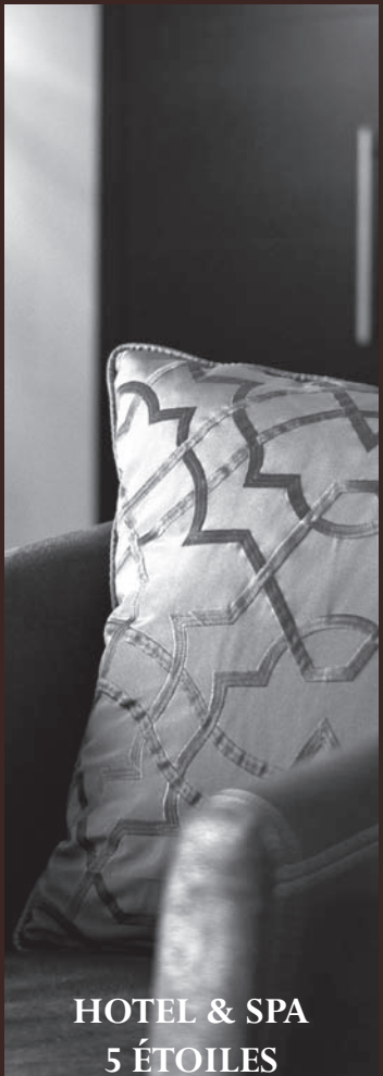
HOTEL & SPA 5 ÉTOILES