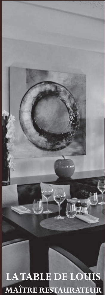
LA TABLE DE LOUIS MAÎTRE RESTAURATEUR