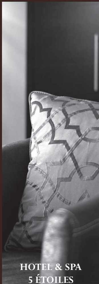
HOTEL & SPA 5 ÉTOILES