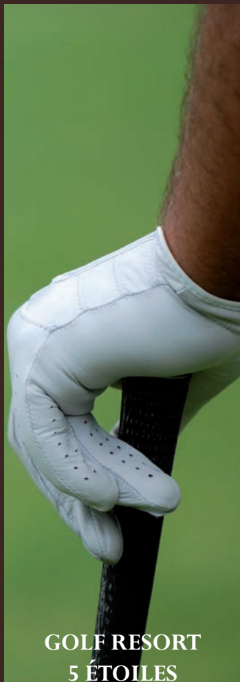
GOLF RESORT 5 ÉTOILES