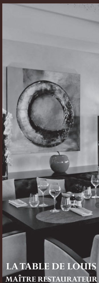
LA TABLE DE LOUIS MAÎTRE RESTAURATEUR