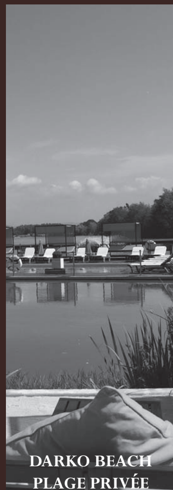
DARKO BEACH PLAGE PRIVÉE