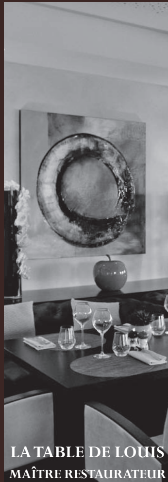
LA TABLE DE LOUIS MAÎTRE RESTAURATEUR