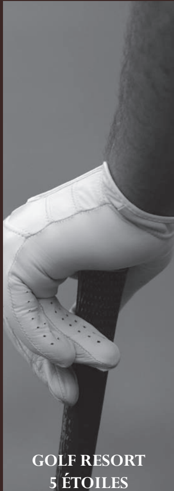
GOLF RESORT 5 ÉTOILES