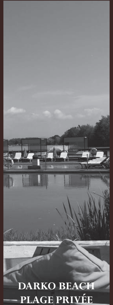
DARKO BEACH PLAGE PRIVÉE