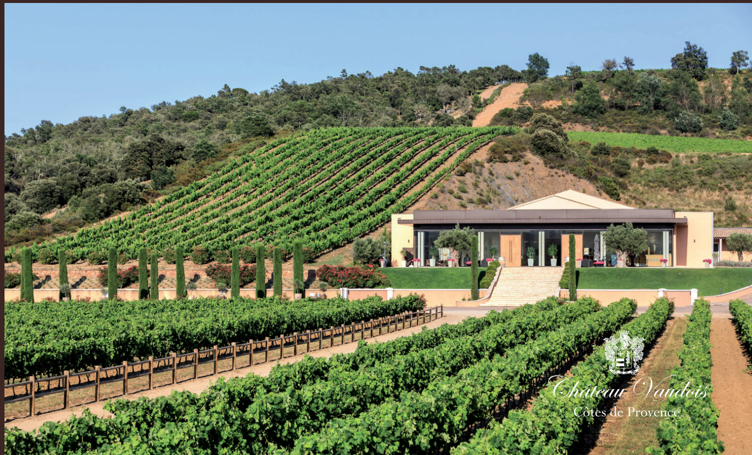
Château Vaudois Côtes de Provence