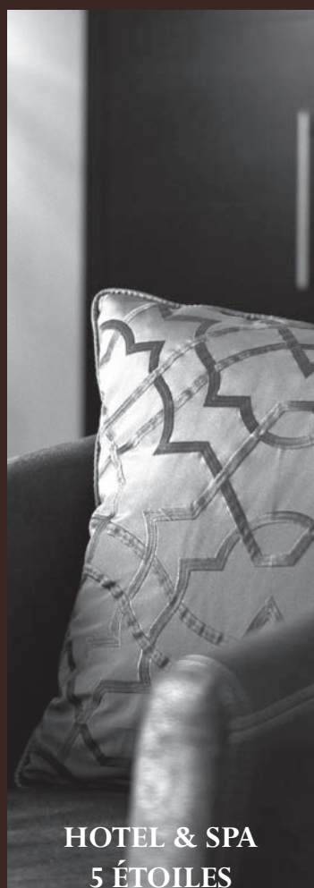
HOTEL & SPA 5 ÉTOILES