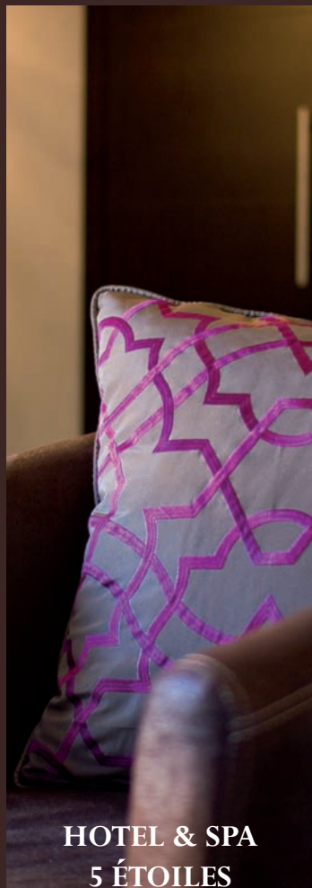
HOTEL & SPA 5 ÉTOILES