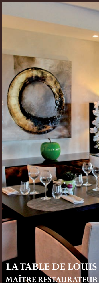
LA TABLE DE LOUIS MAÎTRE RESTAURATEUR