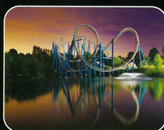
Séminaires & Parcs à Thèmes